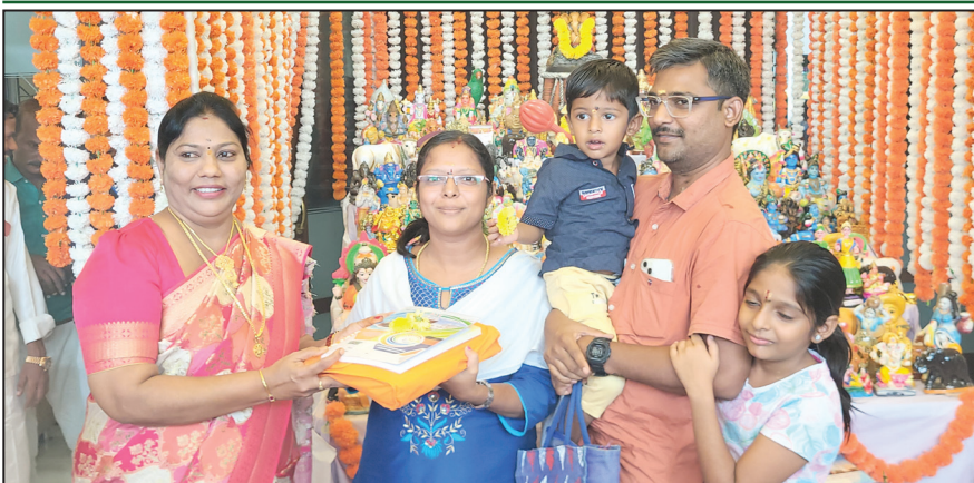
காஞ்சிபுரம் விஜயதாமி நாளை முன்னிட்டு பிஏவி பன்னாட்டு மேல்நிலைப் பள்ளியில் குழந்தைகள் சேர்ப்பதற்காக ஏராளமான பெற்றோர்கள் வந்திருந்தனர் இங்கு இன்று நிகழ்ச்சி நடைபெற்றது இதில் ஆர்வத்துடன் குழந்தைகள் நெல் பயிரில் கல்வியை துவக்கினர்.